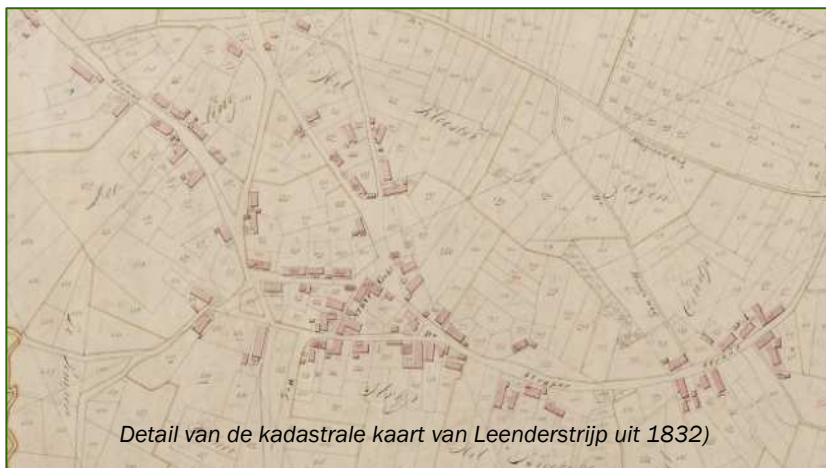
Detail van de kadastrale kaart van Leenderstrijp uit 1832

Even kijken hoe uw perceel er ruim 100 jaar geleden voorstond? Er is een website waar je dat kunt vinden: http://watwaswaar.nl/ Oude topografische kaarten maar ook kadastrale kaarten zijn op deze website te vinden. De schaal van de kaarten is vaak 1:25.000. Dat geeft een gedetailleerde kijk: 1 mm op de kaart is 25 meter in het veld. Uit onze omgeving zijn de oudste kadastrale kaarten in te zien. Zij dateren van rond 1830. De oudste topografische kaarten stammen uit ongeveer dezelfde tijd.