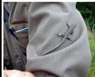
Levendbarende hagedis

Uitgever is de Rijksdienst voor het cultureel Erfgoed.