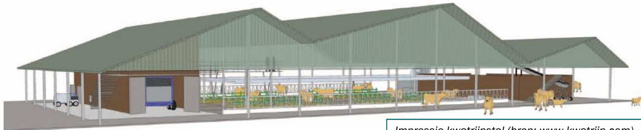
Impressie kwatrijnstal

“Het klopt dat de bouwkosten hierdoor met duizend euro per koeplaats toenemen. Exclusief melkinrichting hebben we het dan over € 5.500 per koeplaats bij een stal voor 80 koeien. Uit berekeningen door Wageningen Universiteit blijken hier echter flinke financiële voordelen tegenover te