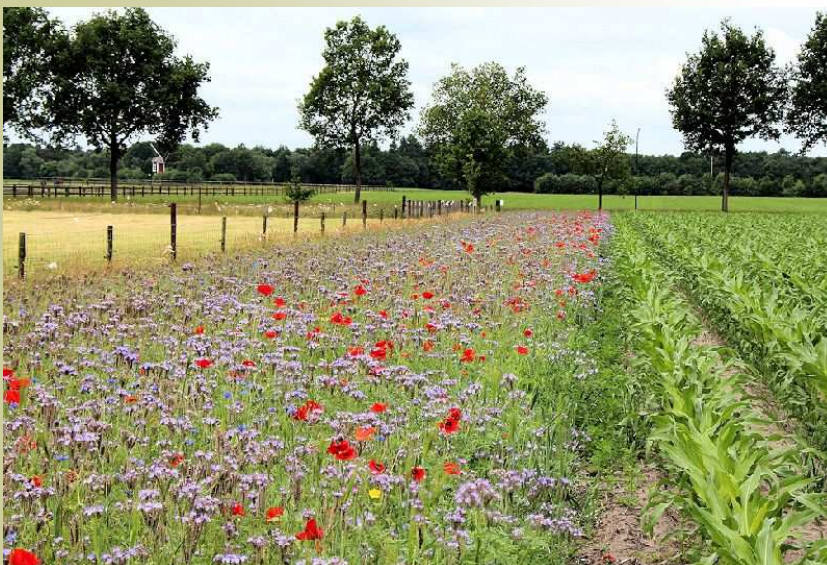
Fraaie akkerrand met klaprozen en Phacelia aan de Hoogeindseweg

Flora en fauna randen staan steeds meer in de belangstelling. Een mooie strook langs de akker (akkerrand) of een strook naast een weide is een lust voor het oog. Daar blijft het niet bij als de 'bloemen' in de rand goed gekozen worden. Ze helpen dan mee om plaaginsecten in toom te houden. Er zijn dan minder of geen bestrij-