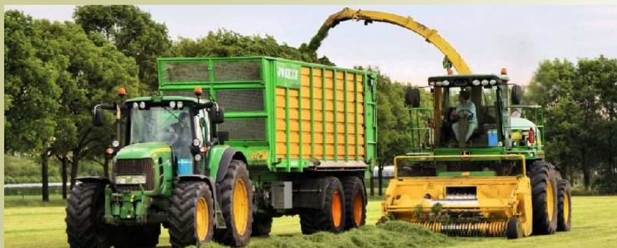
Gras oprapen

Het oprollen van de haspel gebeurt met 'waterkracht'. Het water stroomt in de haspel door een kleine turbine. De turbine draait door de stroming van het water en drijft zo de haspel aan. De haspel trekt de slang en het spuitkanon langzaam terug. Als de slang helemaal opgerold is drukt het spuitkanon tegen een mechaniek waarbij de druk in de toevoerleiding wegvalt. De waterpomp signaleert dit en valt automatisch uit. Tijd om dan de haspel weer op een volgende plaats in te zetten.