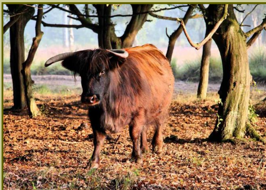
Schotse Hooglander, De Groote Heide Leenderbos