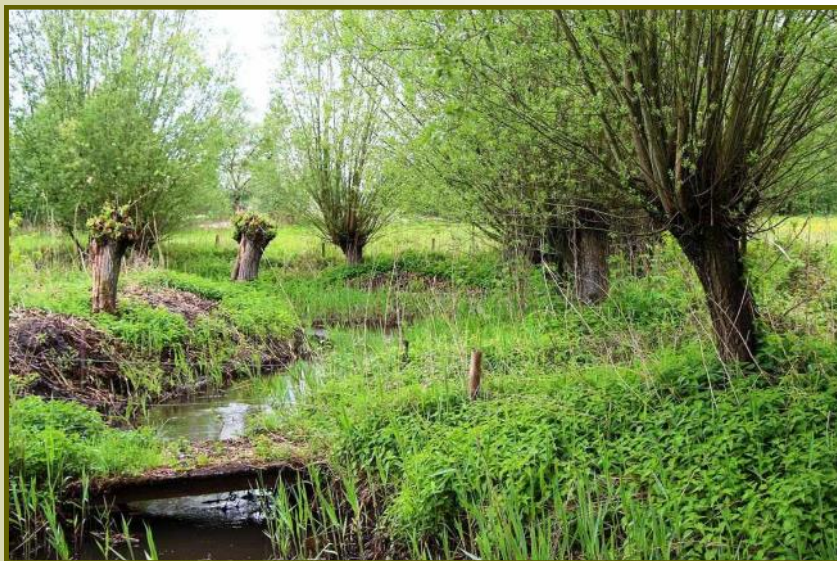
Knotbomen langs aftakking van de Grootte Aa, Leende

C ursussen. ANV Land van Cranendonck organiseerde samen met onze Plattelandsvereniging in dit winterseizoen twee cursussen: "Aanleg & Onderhoud van knobbomen" en "Aanleg & Onderhoud van lijnvormige landschapselementen".