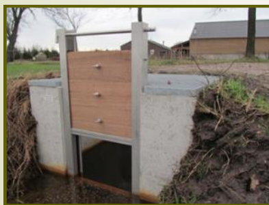
Lopstuwje aan de Renheide

-wordt het water hij op een 'veilige stand' gehouden?