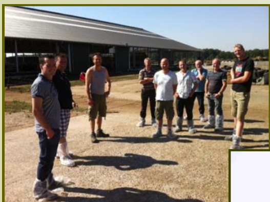
Deelnemers melkveeacademie

In de volgende nieuwsbrief komen we hierop terug. (de redactie)