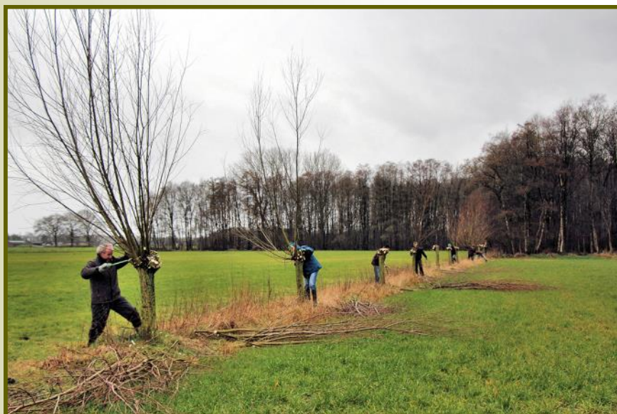
Knotbomen Strijperdijk, Leende