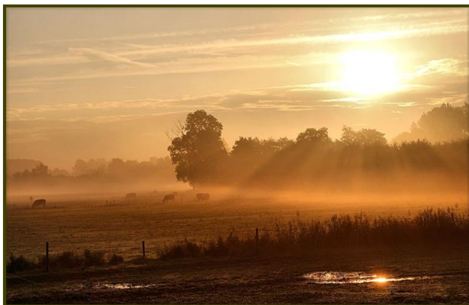
Koeien in de ochtendmist, Leenderstrip