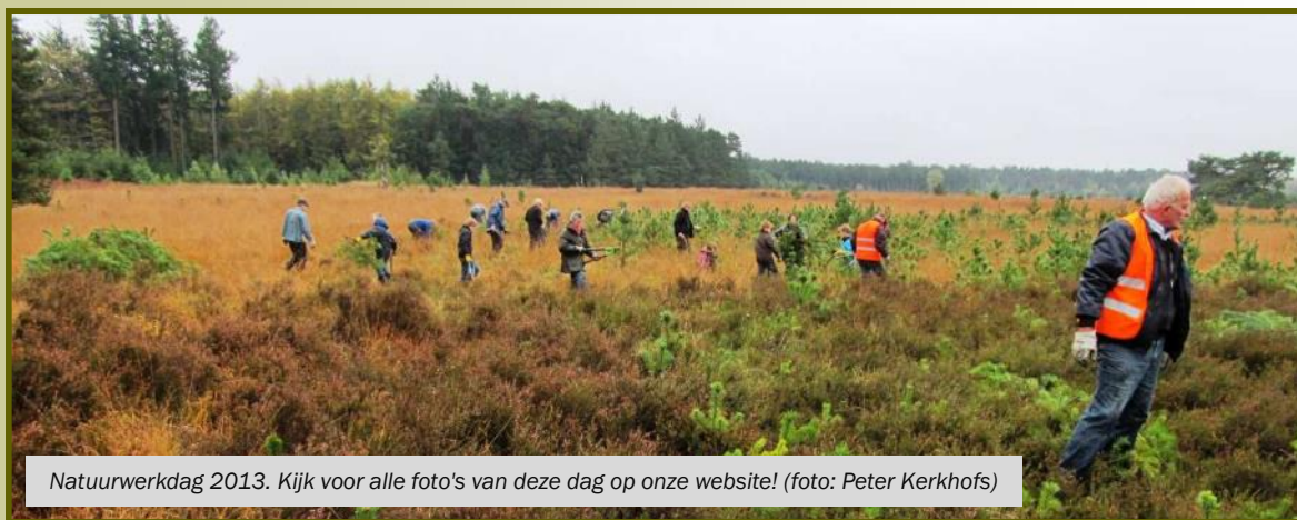
Natuurwerkdag 2013. Kijk voor alle foto's van deze dag op onze website!