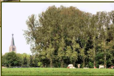
Kerk Leende