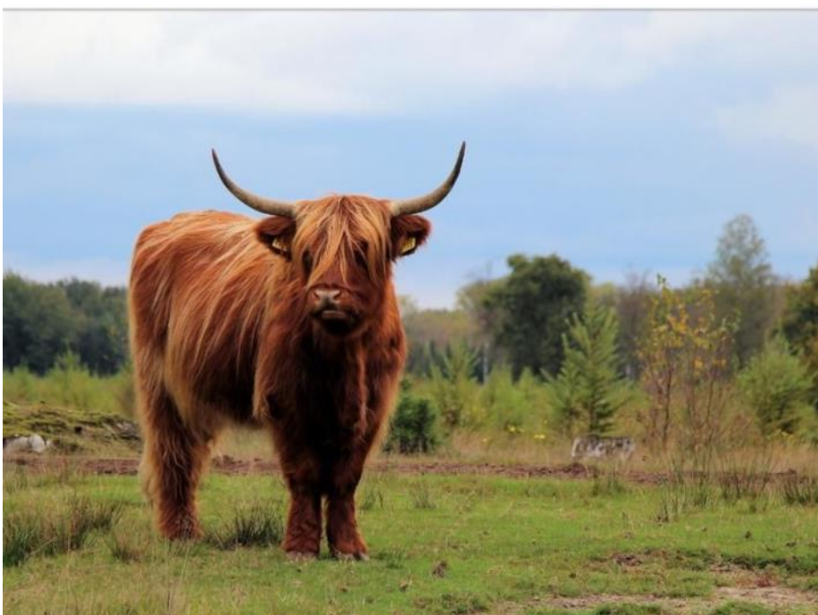
Schotse Hooglander staat model

Hoe dat in praktijk gaat werken is nog even de vraag. Dat zal voor een belangrijk deel afhangen van de deelnemende gemeenten: zij bepalen tenslotte wat er in het gebiedscontract wordt opgenomen.