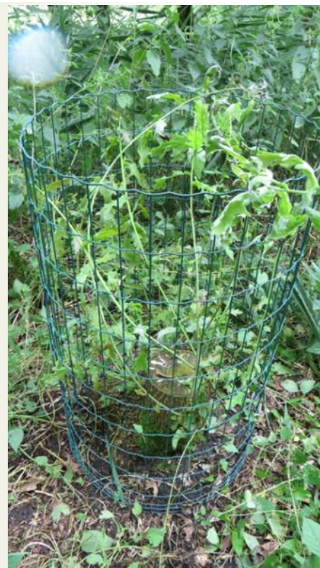
Een eiken stoof beschermt door 80 cm hoog Bekaert gaas. De uitlopers worden niet aangevreten door reeën.

In het nieuwe Agrarisch Natuurbeheer komen mogelijkheden om elementen aan te leggen voor akkervogels. We hopen dat ook de patrijzen hiervan gaat profiteren. Rest ons alle deelnemers te bedanken voor hun bijdrage aan het project.