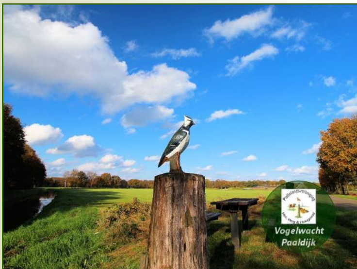
De Kievit, inmiddels weer terug op zijn vertrouwde plek en in zijn eigen verenkleed

Een fietser uit Heeze, zag de kievit in de berm langs de Paaldijk liggen en nam hem mee naar huis. Hij had op dat moment geen idee waar de Kievit vandaan kwam maar herkende hem later direct op de foto in de Parel. De eerlijke vinder nam contact op met Brabants Landschap die vervolgens Jac Seijkens van de weidevogelwerkgroep inlichtte. Toen deze hem bij de