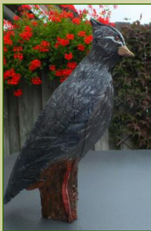
De kievit, na zijn verblijf in Heeze