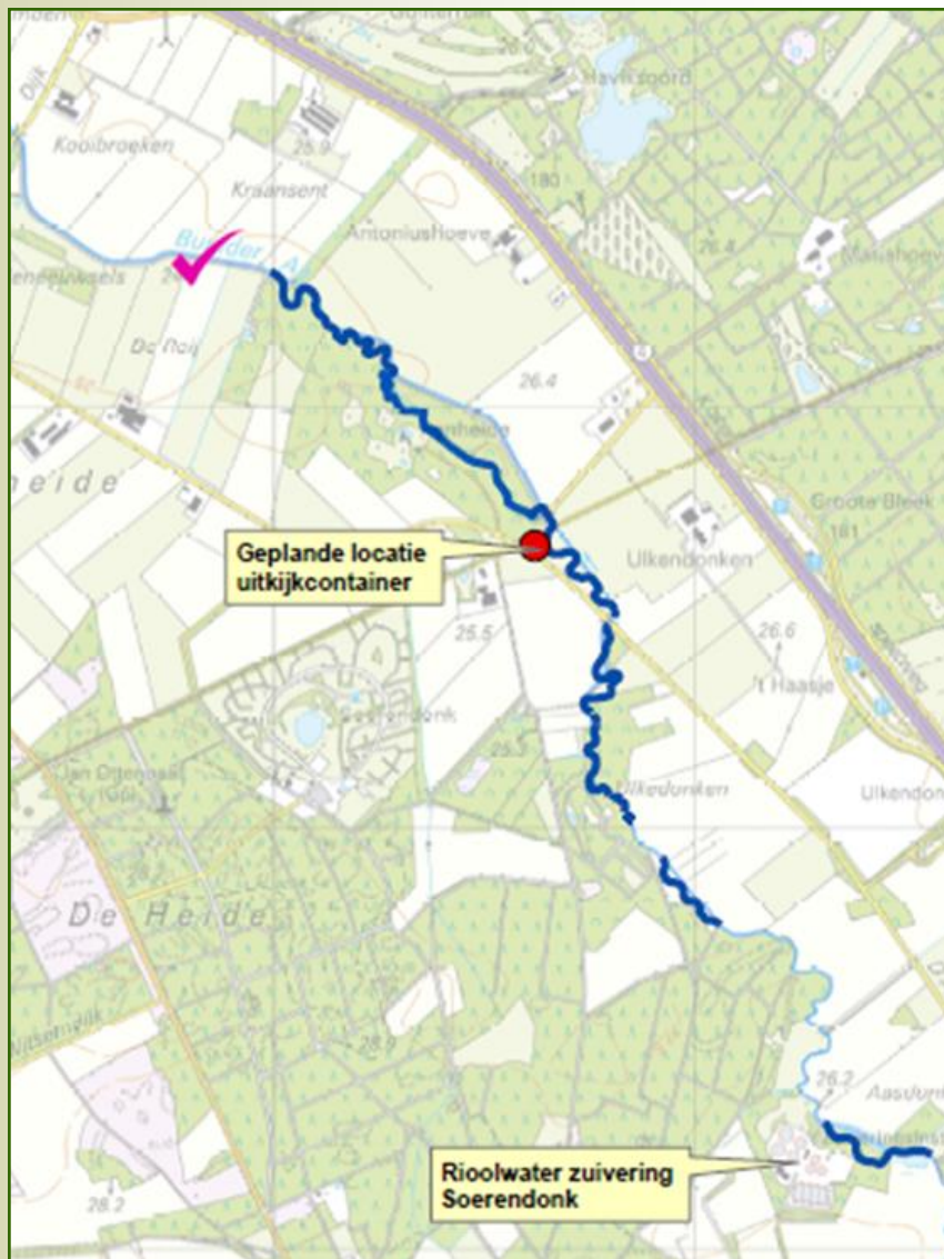
Renheide op peil. De dikke blauwe lijnen geven aan waar de nieuwe, meanderende beek gepland is. De dunne blauwe lijntjes zijn bestaande te handhaven beek.

Medio januari 2016 kunnen belangstellenden een kijkje nemen bij de werkzaamheden in het gebied. Waterschap de Dommel plaatst namelijk een tijdelijk mobiele uitkijkpunt op de kruising van 'd Aasdonken en Raadbroek. De plaatsing van het uitkijkpunt is wel afhankelijk van de weersomstandigheden. Op de kaart ziet u ook in een oogopslag waar de nieuwe beek gaat lopen.