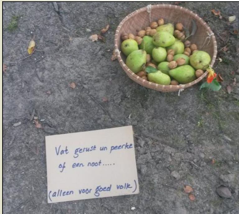
Dit mandje stond deze zomer aan de Strijperstraat ter hoogte van nr 57c/d.

http://nieuwsbrief.bratpack.nl/uploads/251/files/vbne-arbowet-zzp-web.pdf