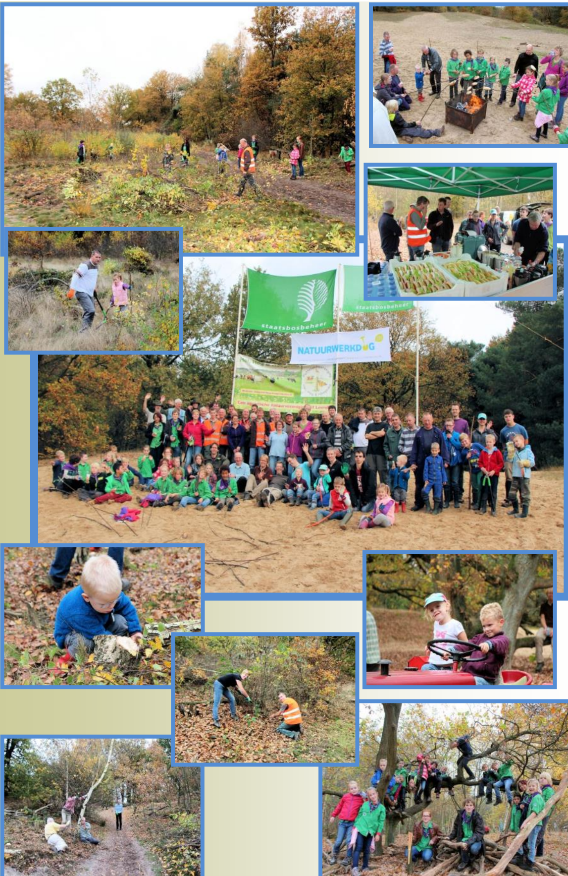
Foto impressie van de Natuurwerkdag 2015 in het Leenderbos