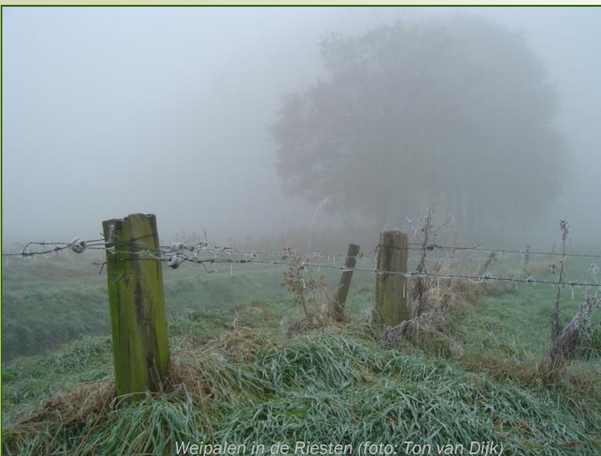
Weipalen in de Riesten

Natuurlijk hout voor palen zijn de palen van lariks, acacia, eik en tamme kastanje. Onbehandeld gaat de acacia het langste mee: ca. 20 jaar, de eik en de tamme kastanje tussen de 10 en 15 jaar, de lariks ongeveer 10 jaar.