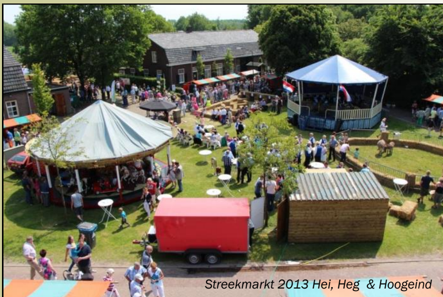
Streekmarkt 2013 Hei, Heg & Hoogeind

Als één van de vele activiteiten van het 100-jarig bestaan van de school en de winkel in Leenderstrijp, wordt er een streekmarkt georganiseerd op zondag 12 juni 2016.