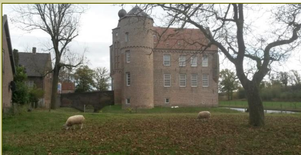
Kasteel Croy te Aarle-Rixtel