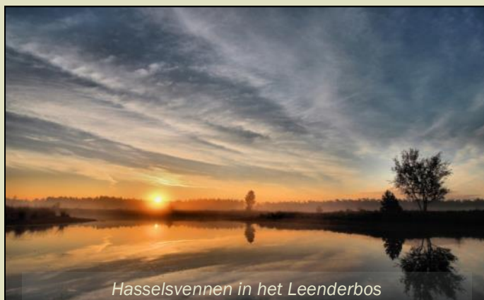
Hasselsvennen in het Leenderbos

Het Stimuleringskader is alleen een succes als er ook gebruik van wordt gemaakt! Graag willen we u uitnodigen om gebruik te maken van de regeling. Het aanleggen en het onderhouden van