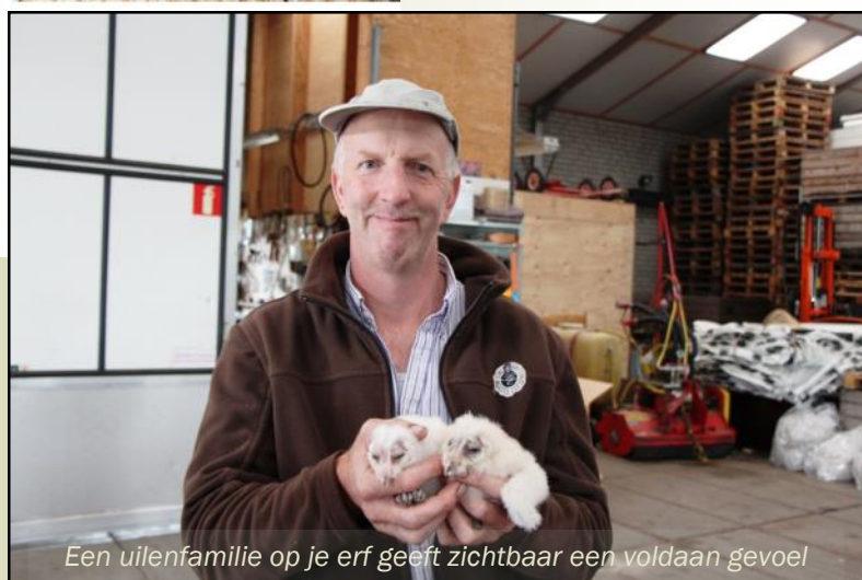
Een uilenfamilie op je erf geeft zichtbaar een voldaan gevoel

Dit houdt in dat de uilen worden gewogen, de vleugellengte wordt gemeten, het vetgehalte wordt bepaald en dat de uilen worden geringd.