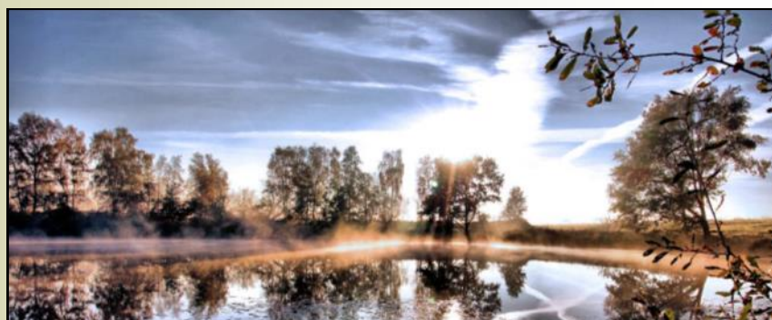
'Gat van Winters', Leenderstrijp