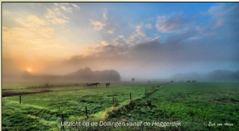
Uitzicht op de Dollingen vanaf de Heggerdijk

Dinsdag 16 februari 2016 20:30 Lezing (zie pag. 3) Woensdag 16 maart 2016 20:30 Lezing (zie pag. 3) Maandag 18 april 2016 20:30 Algemene ledenvergadering