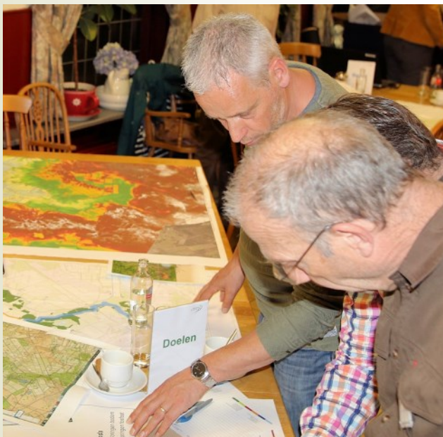
Waterschapsavond foto 2

De plannen worden nu voorbereid, samen met provincie en andere partners en in overleg met betrokkenen. In 2021 moet het werk klaar zijn.