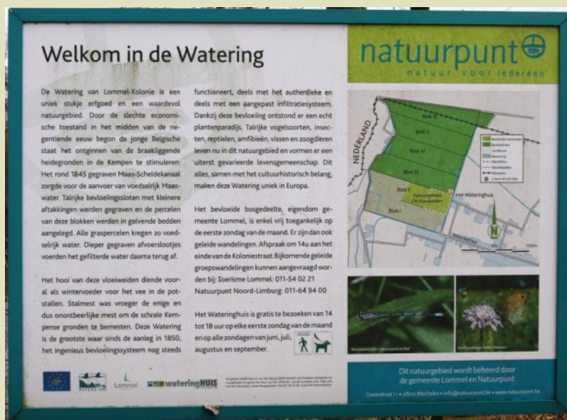
Informatiepaneel langs de wandelroute

https://www.natuurpunt.be/natuurgebied/vloeiveiden