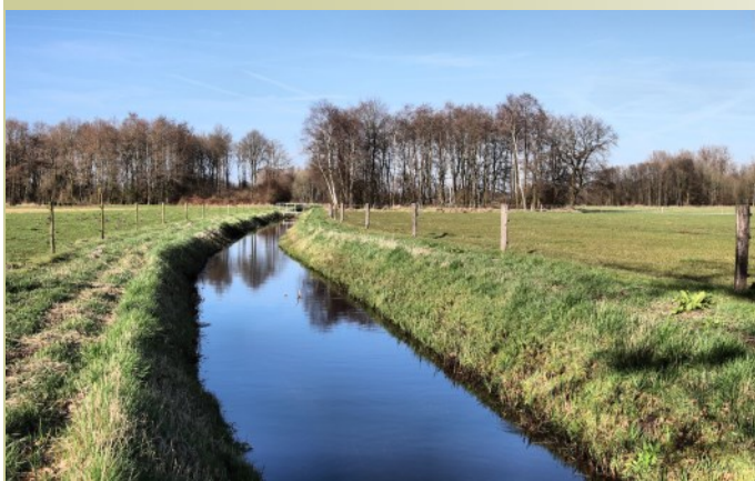
Oude Strijper AA ter hoogte van de Heggerdijk

Op dinsdag 4 april jl. organiseerde Waterschap De Dommel een inloopavond in de Hospes. Projectmedewerkers stonden daarbij klaar om grondeigenaren en pachters te informeren over het komende project rond de Oude Strijper Aa. Het waterschap gaat het beekdal herinrichten, om de natuur in en rond het water te versterken. Stukken bos en vennen dreigen te verdrogen en de natte natuurparel staat onder druk door de stikstofuitstoot. Bijzondere planten en diersoorten in het van oorsprong moeras- en vennengebied zijn (bijna) verdwenen.