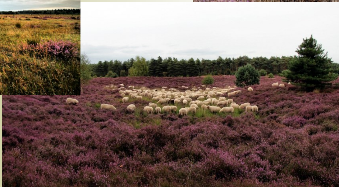
Schapen op de heide