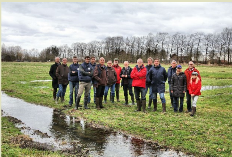
Groepsfoto in de vloeiveiden

De wandeling zou geopend worden met een inleiding, onder het genot van een kop koffie en een stukje Vlaamse vlaai. Door een lichte vertraging en de onzekerheid van het weer die middag, zijn we direct aan de wandel gegaan. In 1850 is hier een doordacht stelsel van sloten en stuwen aangelegd. Deze sloten worden gevoed door het kanaalwater, welke op zijn beurt weer door Maaswater word gevoed.