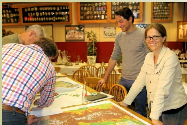
Waterschapsavond foto 1

Om ervoor te zorgen dat het gebied beter water kan vasthouden, krijgt de Oude Strijper Aa ter hoogte van natuurgebied de Gastelsche Heide meer ruimte. Bij hevige regenval stroomt het water dan minder snel naar het landbouwgebied stroomafwaarts. Vanaf Strijperheg tot aan fietspad de Riesten, krijgt de beek een meer natuurlijke, langere loop. De beek zal daar minder diep worden en ruimte krijgen om gecontroleerd buiten zijn zomerbed te kunnen treden. Dit alles moet bijdragen aan een meer gedoseerde waterafvoer, minder wateroverlast en minder last van droogte.