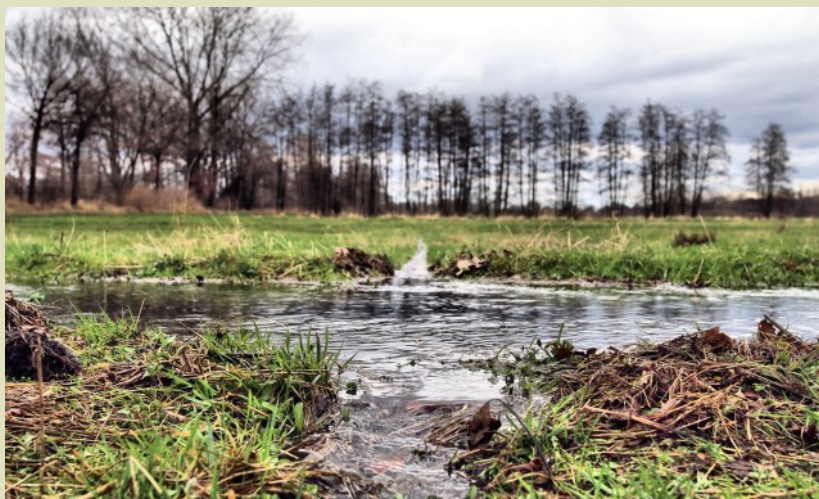
Het water stroomt van de hoofdgrepel naar de kleinere greppels om zo de weide te bevoeien.

Dit slim aangelegde stelsel wordt gebruikt voor het bevoeien van weides. Door een netwerk aan te leggen van steeds kleinere doodlopende slootjes en greppeltjes in de weides vloeit het water naar de lager gelegen greppels en sloten. Het voedsel- en kalkrijke Maaswater vloeit door de graszoden. Voedingsstoffen, zoals kalk, blijven achter op de weides. Het bevoeien werd aanvankelijk gebruikt als belangrijke schakel om woeste heideterreinen te ontginnen. Hooi van vloeiveiden werd gebruikt als veevoer. Met de mest die dit vee produceerde werden voedselarme akkers bemest voor de akkerbouw.