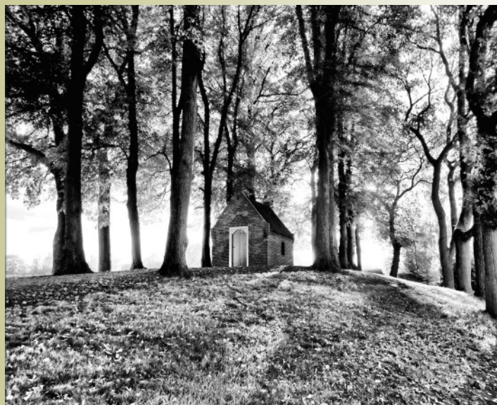
De Sint Janskapel bij het ochtendgloren