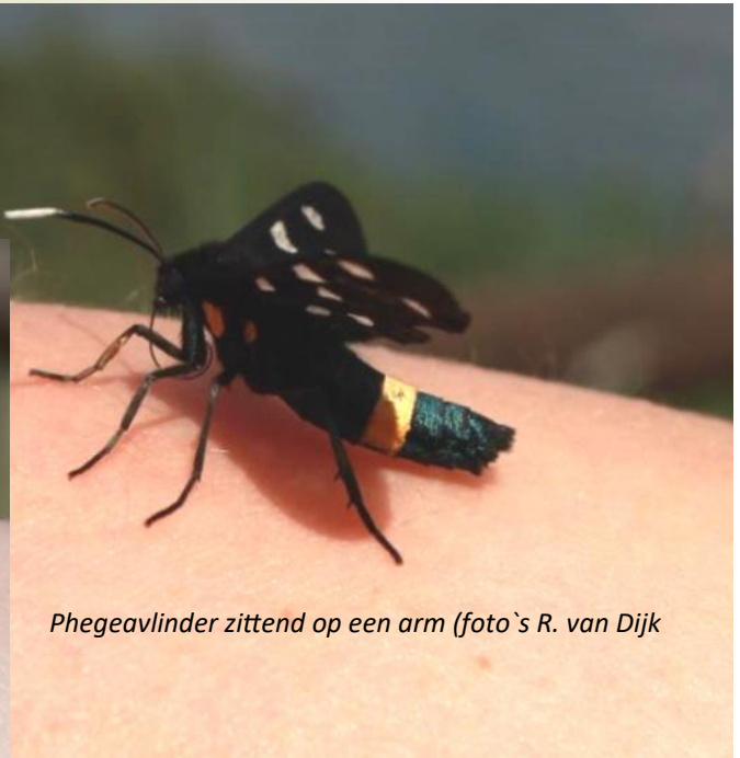
Phegeavlinder zittend op een arm