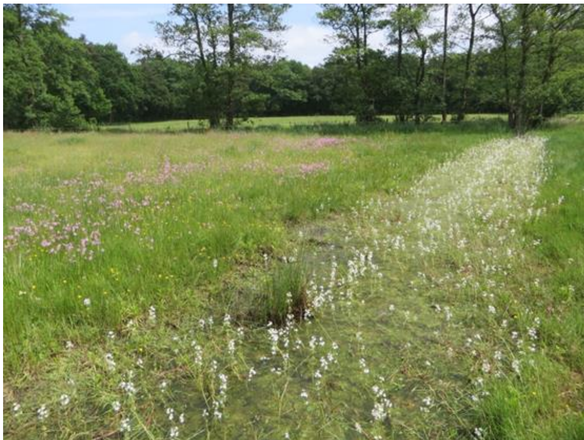
Zwaar beheer op botanisch hooiland is niet alleen goed voor de biodiversiteit maar ook voor het oog: koekoeksbloemen (roze) en waterviolier (witte bloemen) op een perceel