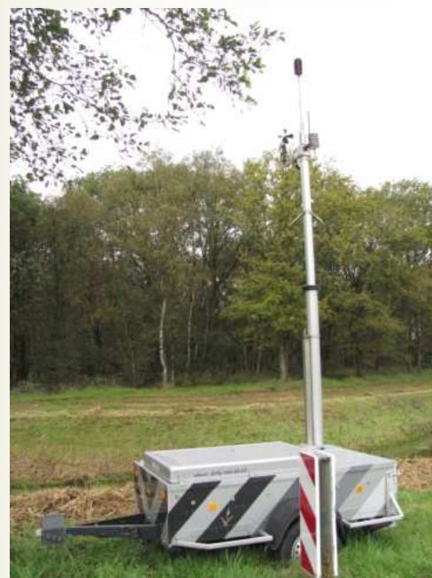
Meetapparatuur aan de Paaldijk

Er is een uitgebreid rapport beschikbaar waarin de meetmethode en de meetresultaten zijn opgenomen.