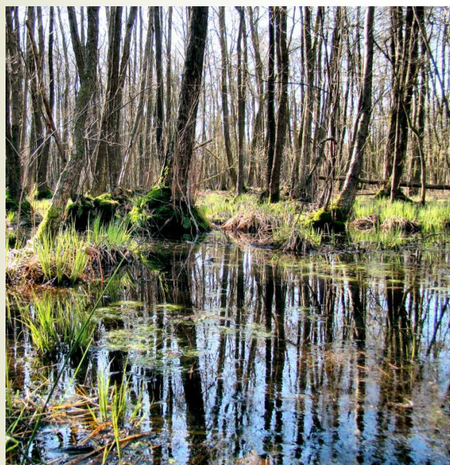
Elzenbroek in de Riesten

Granen verdampen vroeg in het jaar dus meer dan maïs. Later in het seizoen is dat omgekeerd (als de beschikbaarheid van water al klein is).