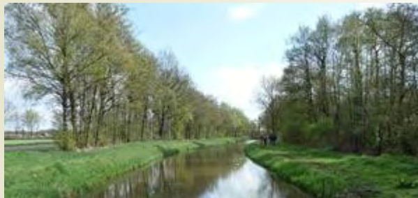
Huidige situatie bij de Strijper Aa

breedte van zo'n 10 meter. Hiermee wordt een langzame natuurlijke overgang van nat naar droog gecreëerd. Deze overgang is een uitste-