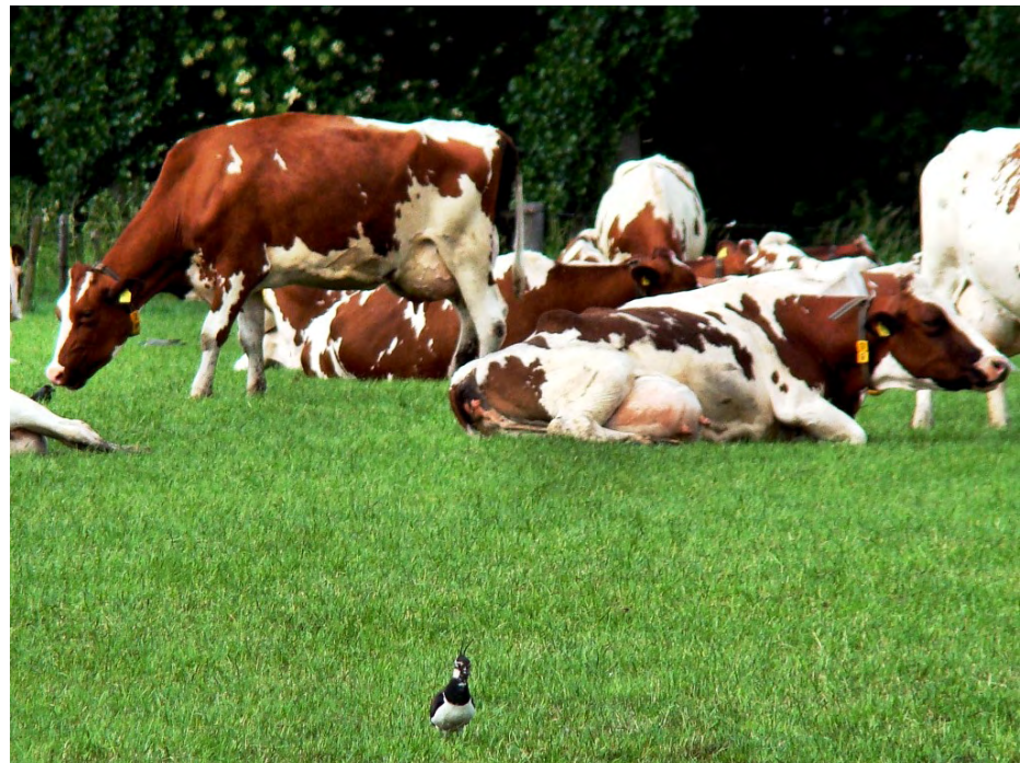
Kievit tussen de koeien