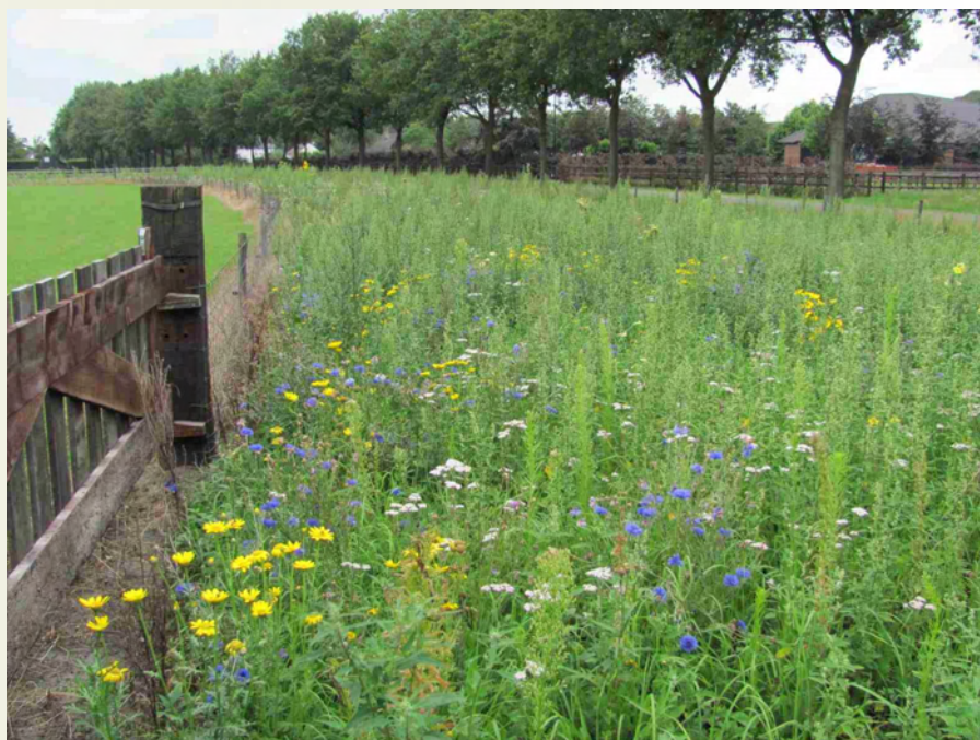
Akkerrand aan de Hoogeindseweg (Fam. Vd Sande)