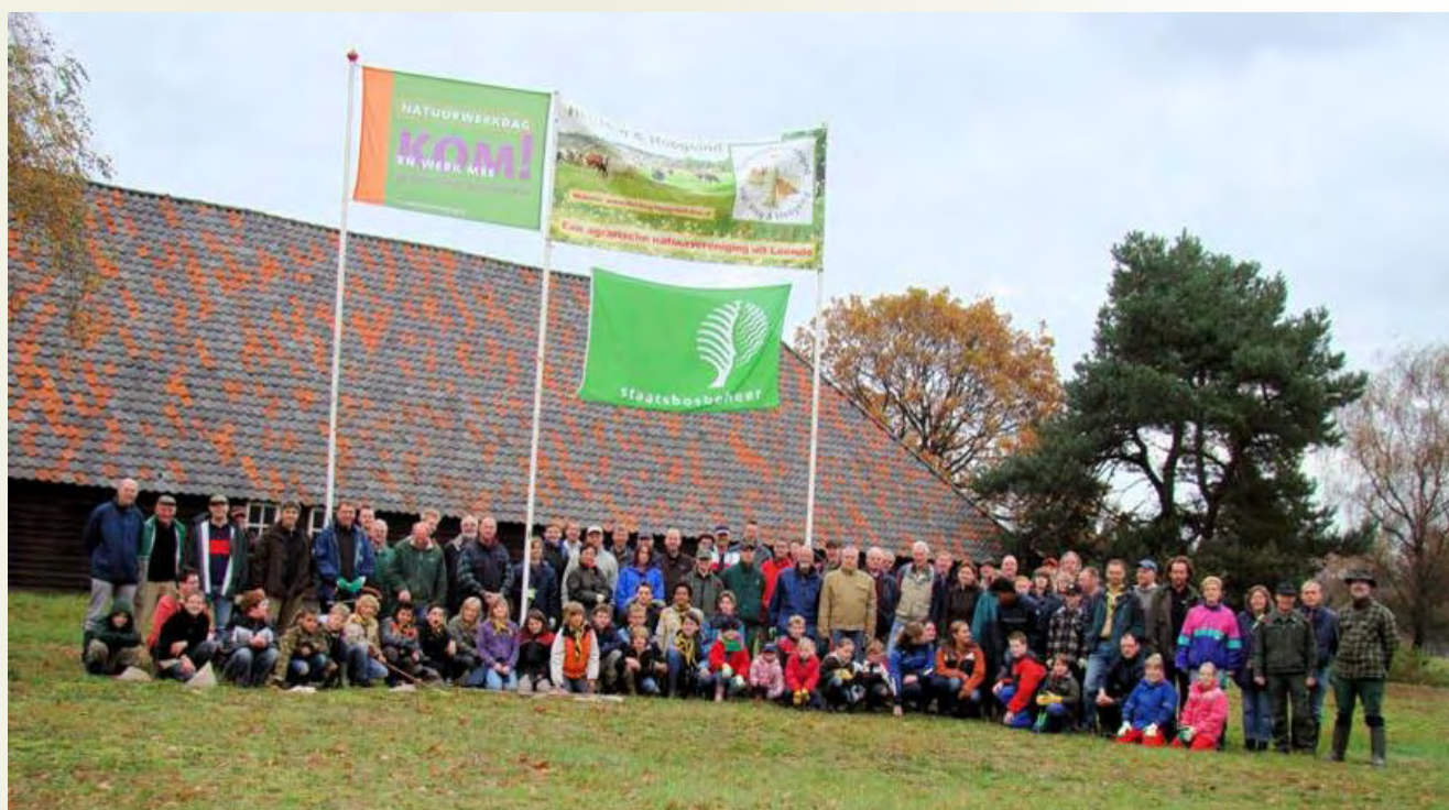
Samenwerking tussen HHH en SBB op de Natuurwerkdag

Districtshoofd Peel & Kempen van Staatsbosbeheer