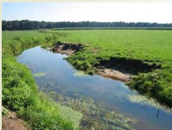
Voorbeeld van een natuurvriendelijke oever

kende groeiplaats voor planten die graag met hun voeten in het water staan. De aanwezigheid van deze planten is weer belangrijk voor vissen en andere kleine diertjes die leven in en net langs de beek. Daarnaast nemen de planten voedingsstoffen op uit het water waardoor ze de waterkwaliteit verbeteren. Wanneer we de mogelijkheid hebben het waterpeil van de beek iets te verhogen zorgen we, naast de kansen die de aanleg van een natuurvriendelijke oever biedt, ook voor meer stroming en meer zuurstof in het water.