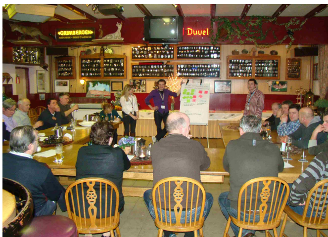
De discussie over de stellingen onder leiding van de 4 HAS studenten

Algemene ledenvergadering op woensdag 14 april