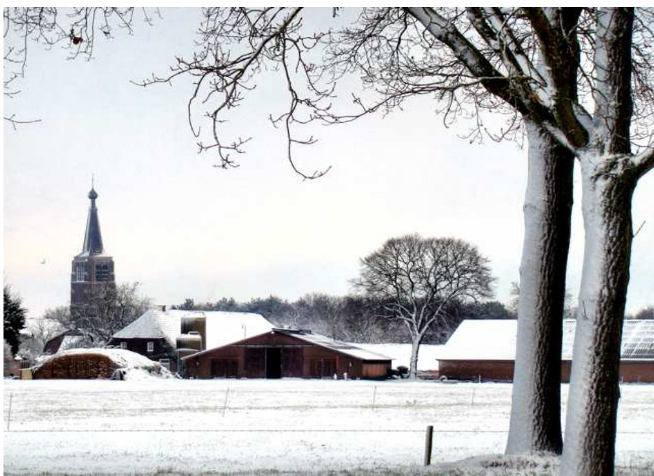
Winters zicht op het Worteleindje