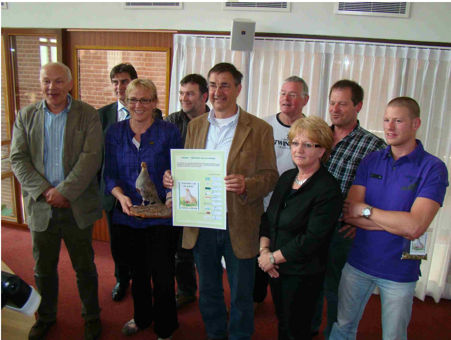
De ondertekenaars van het project "vrienden van de patrijs"