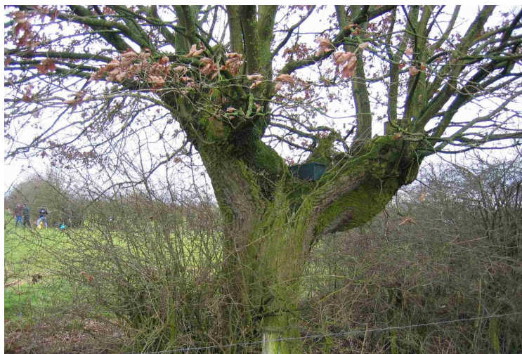
Knoteik met steenuilenkast

Particulier Grondbezit). De volgende kennis en expertise wordt door deze partijen ingebracht: Het Coördinatiepunt Landschapsbeheer levert een bijdrage aan de planvorming. De ZLTO draagt zorg voor de bedrijfsmatige match. BPG kan een bijdrage leveren aan de stimulering van particulier