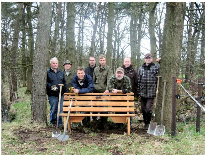
Leden van de HHH natuurwerkgroep bij een van de geplaatste bankjes

Tijdens de wandelroute van circa 6 km kunt u kennis maken met het cultuurlandschap van Leenderstrijp. De route voert door een nat beekdal met moerassen en weiden, hakhoutbos-