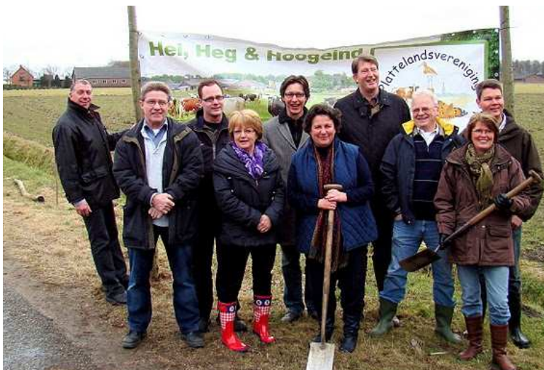
De nieuwe gemeenteraadsleden bij het planten van de wilgenstaken

Afgelopen maanden hebben weer diverse activiteiten plaatsgevonden binnen onze vereniging. Misschien hebt u de wilgenstaken langs de Strijperdijk al gezien. We hebben deze samen met de nieuwe raadsleden geplant. Het ziet er nu nog wat kaal uit maar het eerste schot is al uitgelopen en over een paar maanden kent u ze niet meer terug. Het planten van de knotten was een activiteit in