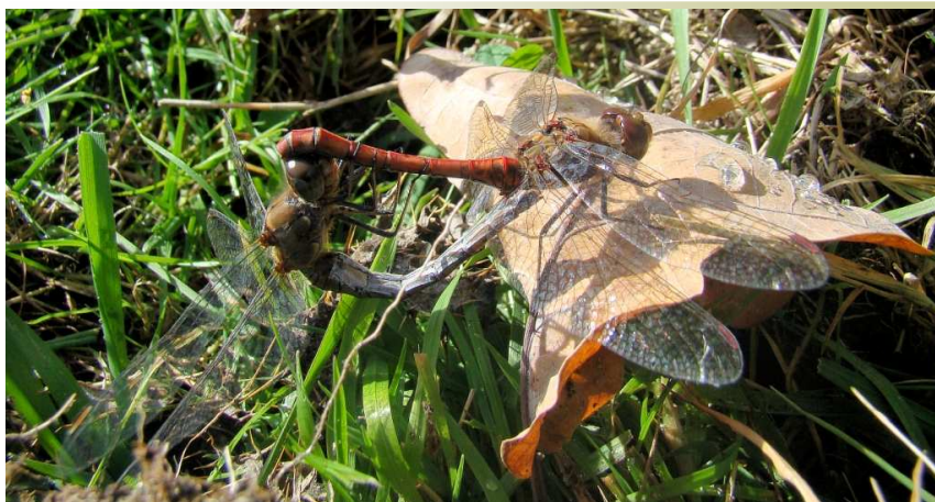
Parende libellen