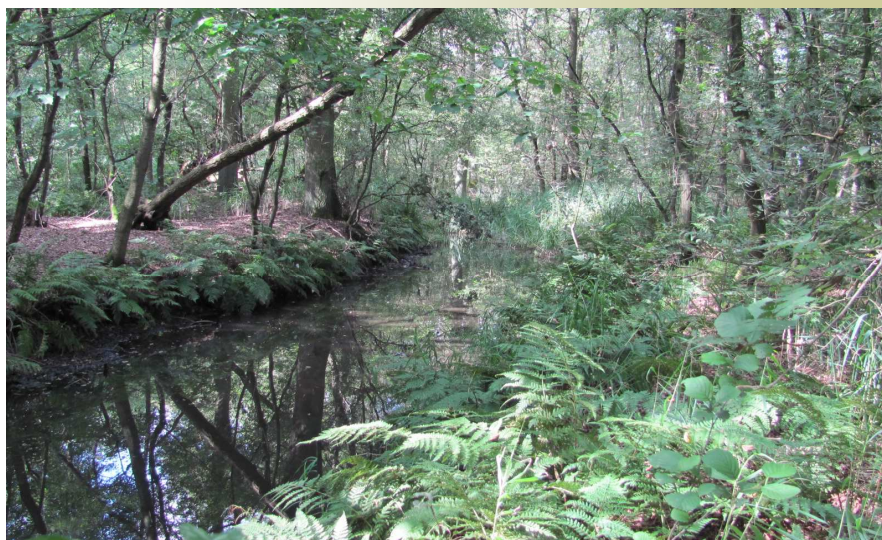
De Buulder Aa op de Renheide