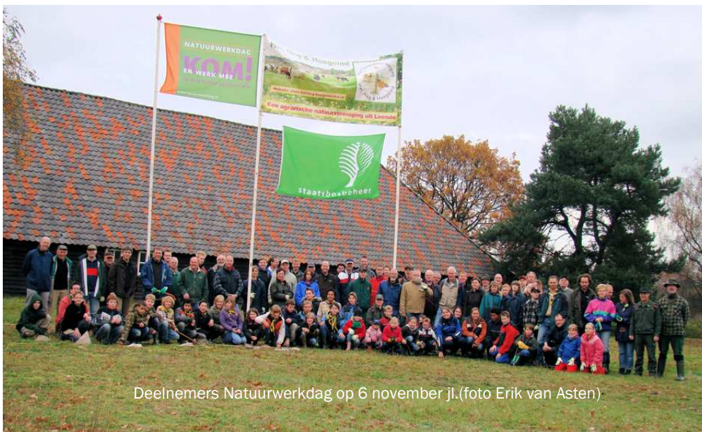
Deelnemers Natuurwerkdag op 6 november jl.