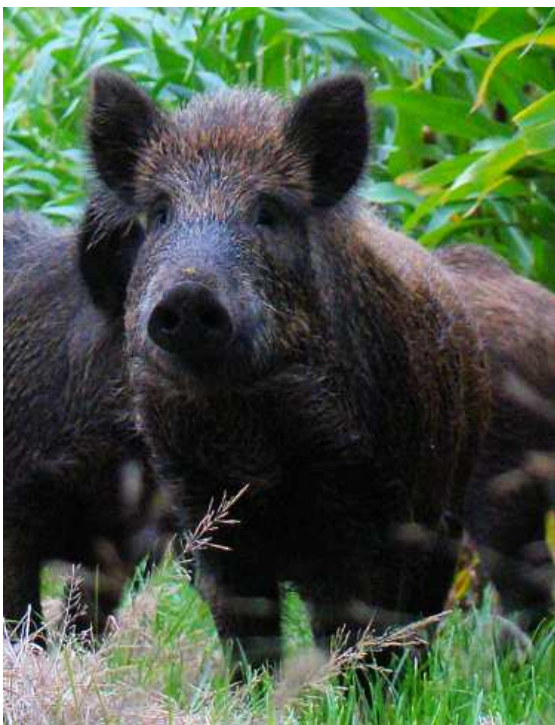
Wilde zwijnen op de Strijperheg

Onze werkgroep Jaarprogramma heeft op donderdag 16 december een thema avond belegd die u niet mag missen. In een breder perspectief wordt de toekomst van- en de problematiek rond het wilde varken in onze omgeving belicht. Het Faunafonds, Fauna-beheereenheid Noord-Brabant en de Zoogdierverseniging hebben voor deze avond hun medewerking toegezegd. U ontvangt nog een definitieve uitnodiging.