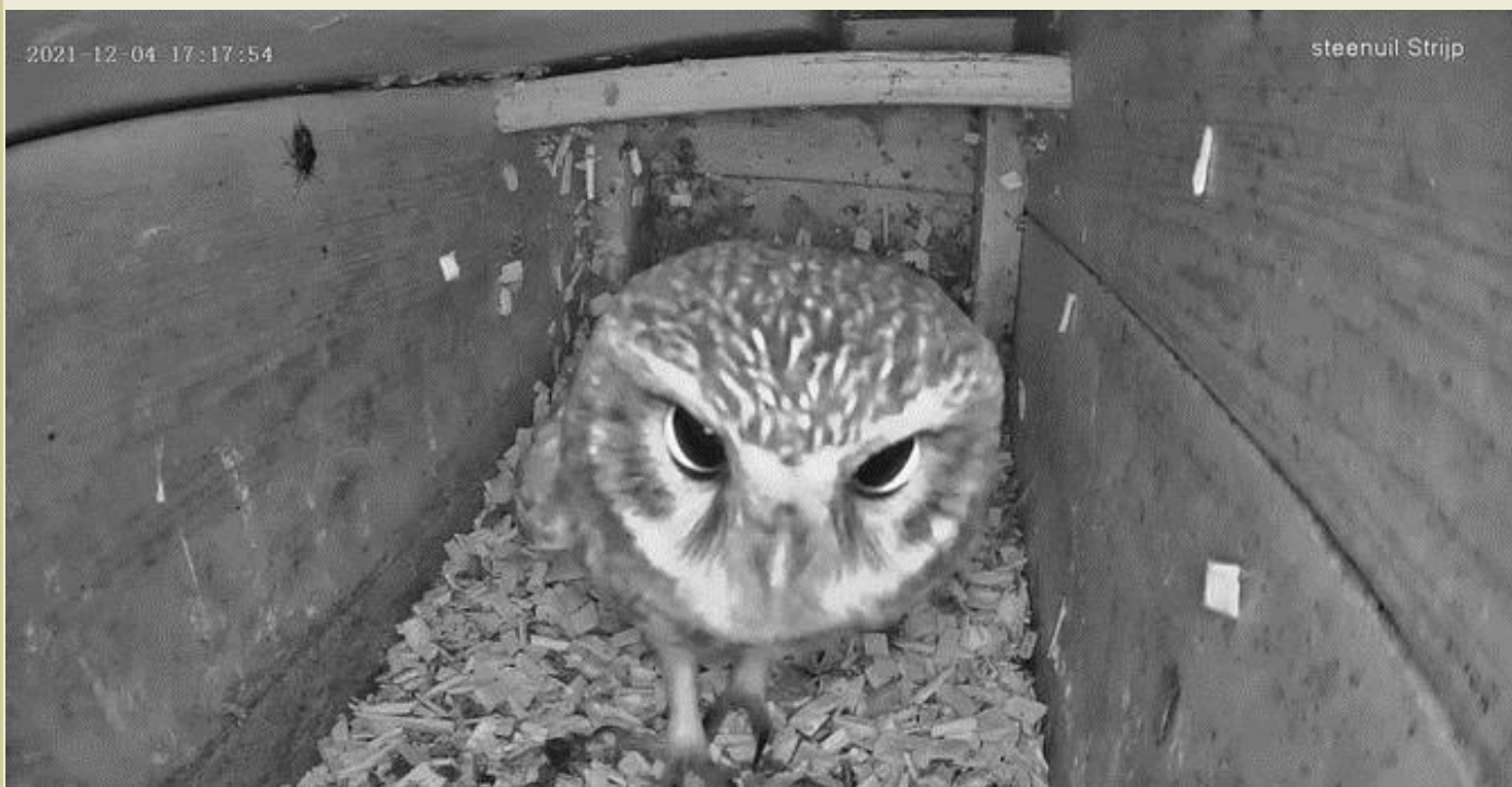
Big Brother is watching you!

Sinds kort kunt u weer live meekijken in verschillende uilenkasten in onder andere Leenderstrip. Ga naar www.steenuilennu.nl voor een glimp in de kast. Vanaf april zullen de eerste steenuiltjes gaan broeden. De bosuilen zitten nu al op hun jongen. Genoeg te zien dus!