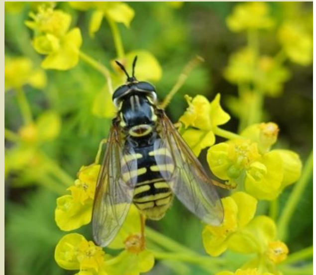
De grote fopwesp: lijkt op een wesp maar heeft in plaats van vier vleugeltjes slechts twee vleugeltjes.

Samengevat: een bloemenrand om bladluizen in het gewas te bestrijden werkt alleen als er de goede plantensoorten voor zweefvliegen ingezaaid worden.