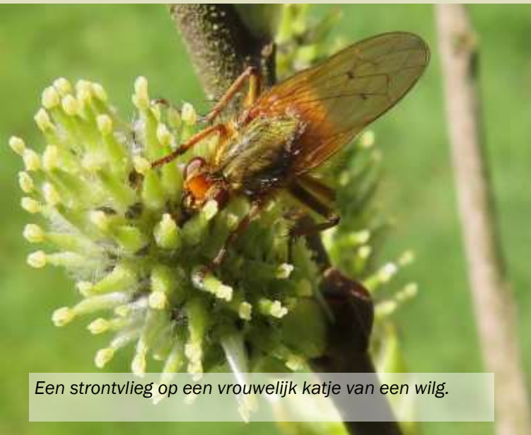
Een strontvlieg op een vrouwelijk katje van een wilg.

De strontvlieg is goed herkenbaar. Hij heeft een geel-groen-bruine (en soms oranje kleur) welke afkomstig is, van de plaatselijk dichte beharing. De vrouwtjes zijn meer groen gekleurd, de mannetjes geel-oranje. Niet de grootste vlieg die we kennen maar toch een flinke: tot 1 cm. De ogen zijn rood en de poten zwart behaard. De vleugeladers met de twee puntjes zijn ook heel herkenbaar.