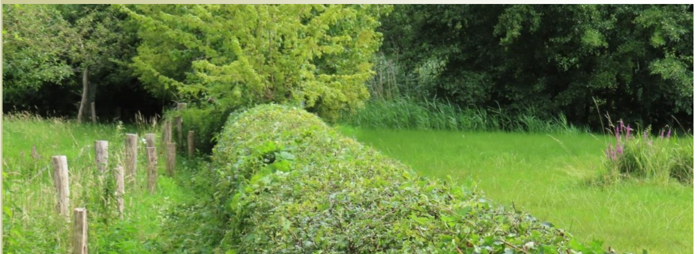
De veldesdoorn leent zich prima in gemengde hagen, zowel als overstaander (achtergrond) als 'geknipt' in de heg.

Als boomkweker krijg ik vaak de vraag of esdoorns giftig zijn voor paarden. Het gaat om de ernstige spierziekte Atypische Myopathie welke tot gevolg heeft dat het paard hieraan sterft. Het komt in dit geval door de giftige stof Hypoglycine A. Deze stof komt alleen voor bij de gewone esdoorn ( Acer pseudoplatanus ), deze is inheems in Nederland. Er zijn nog twee andere esdoorns inheems; de Noorse esdoorn ( Acer platanoides ) en de Veldesdoorn ( Acer campestre ). Deze twee zijn dus niet giftig voor paarden volgens de onderzoeken. De stof is tot nu toe ook niet gevonden in uitheemse esdoornsoorten. Conclusie is dus dat u op moet letten bij het aanplanten en toepassen van de gewone Esdoorn ( Acer pseudoplatanoides ) in de buurt van paarden.