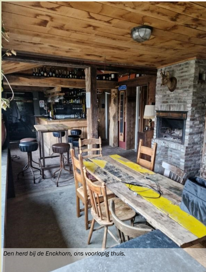
Den herd bij de Enckhorn, ons voorlopig thuis.